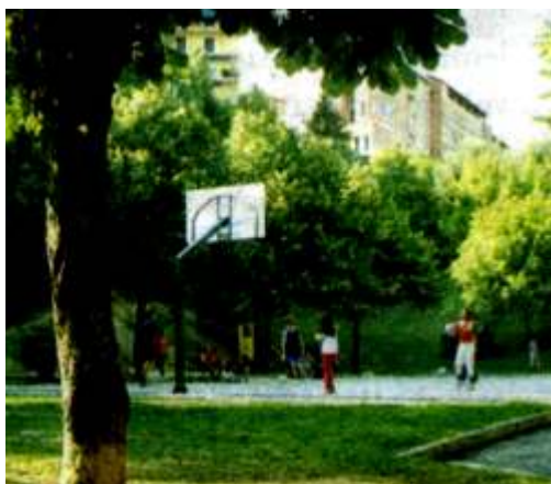
Parco Sant'Anna - Perugia

Emergenza calore Solidarietà e attenzione verso gli anziani perché non si sentano soli