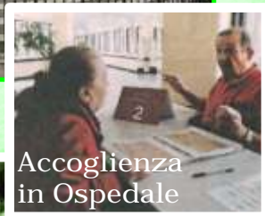
Accoglienza in Ospedale