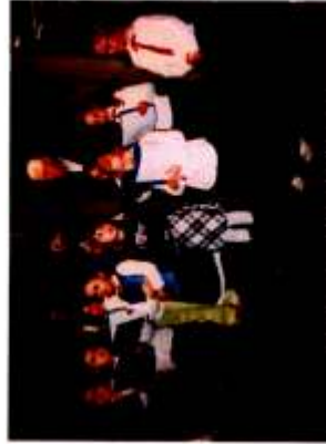
"I piccoli cantori di S. Antonio"