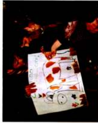
I boy-scouts giocano con gli ospiti, a cui pongono dei quiz

Andiamo nelle Residenze Protette del Perugino ed a domicilio (ogniquale volta ne sorge il bisogno e c'è la disponibilità dei volontari). Facciamo compagnia agli anziani ed ai disabili, soprattutto "ascoltandoli" e quindi dialogando con loro, rendendoli partecipi delle realtà intorno ad essi; inoltre anche con piccoli servizi cerchiamo di migliorare la loro qualità di vita (passeggiate, spesa).